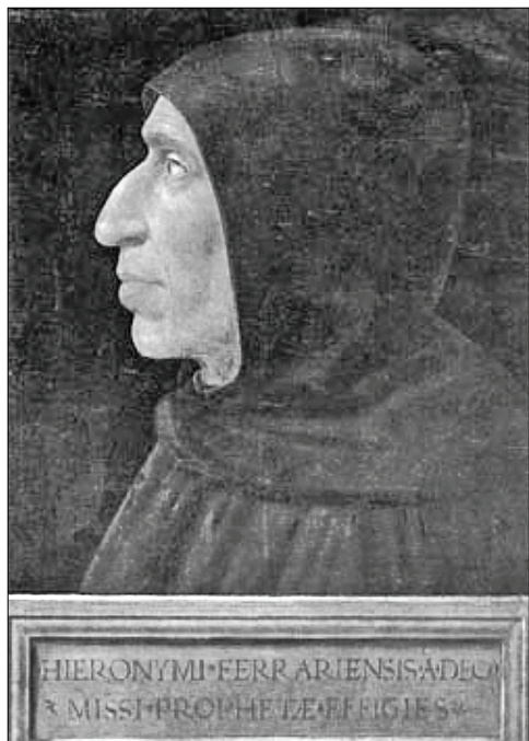
Портрет Джироламо Савонаролы работы фра Бартоломео.

вспоминал, как отвергнутый девушкой, рыдал на скамье в глубине сада. Тогда ему казалось, что жизнь для него потеряла смысл. Именно тогда он задумался о том, почему в мире столько страданий? Почему то, что человек называет счастьем, нередко ускользает от него? Почему несправедливость оказывается могущественней правды? Почему сила подавляет истину? Однажды, будучи на пиру в герцогском дворце, он вышел в сад, чтобы отдохнуть от веселья, и вдруг случайно подслушал разговор двух узников, находившихся в подвале герцогского замка. Он услышал о чудовищной несправедливости заимодавца, безжалостно требовавшего уплаты долга у несчастного крестьянина. Стоны заключенных так противоречили веселью дворца, что Савонарола тогда же поклялся себе, что ноги его больше не будет в этом проклятом доме. Все эти размышления, обстоятельства и разочарования привели его, наконец, к решению вступить на путь монаха. В возрасте двадцати трех лет Джироламо покинул родной дом, и принял монашество в доминиканском монастыре в Болоньи.