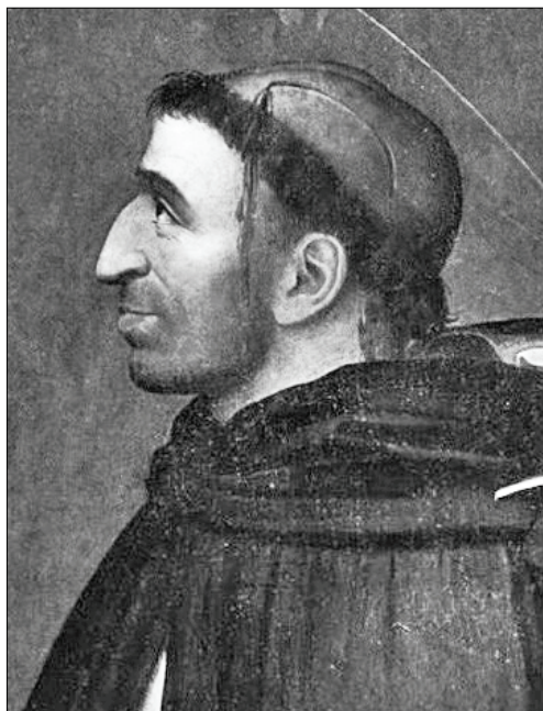
Савонарола в виде католического святого Петра Веронского (портрет Фра Бартоломео).

Джироламо Савонаролу можно назвать предтечей Реформации, как и Яна Гуса и Джона Виклифа. Эти люди предвосхитили дух протестантизма, проявившийся в полной мере в деле Мартина Лютера. Литературное наследие Савонаролы представлено такими замечательными произведе-