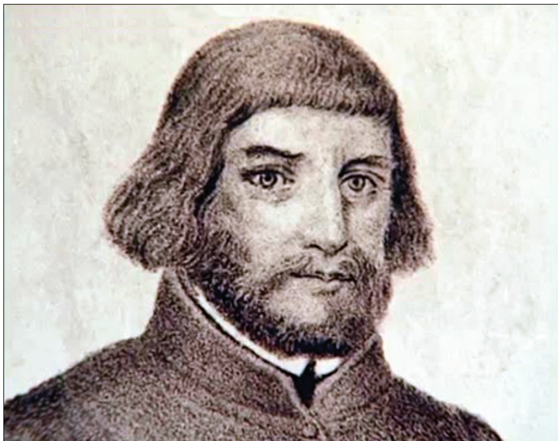
Петр Хельчицкий (ок.1390–ок.1443)

Хотя он считается духовным отцом Единого братства ( Jednota bratrská , по-чешски; Unitas fratrum , на латыне) или чешских братьев, после его смерти писания Хельчицкого исчезли из памяти, из-за усилий католической контрреформации. Он заново стал известным только в девятнадцатом веке, когда так называемые «будители», такие как Франтишек Палацкий (1798–1876), искали исторические корни чешского народа и популяризировали историю гусситов. Несмотря на это, Хельчицкий до сих пор остается неизвестным многим христианам из-за того, что большинство его работ никогда не были переведены на главные европейские языки. Поэтому канадский богослов Йаролд Земан