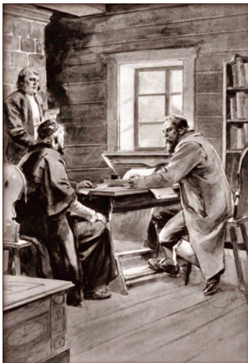
Петр Хельщичский беседует с чешскими братьями.

В конце концов, в Констанце епископы собирались на собор с 1414 по 1418 гг., чтобы положить конец расколу в