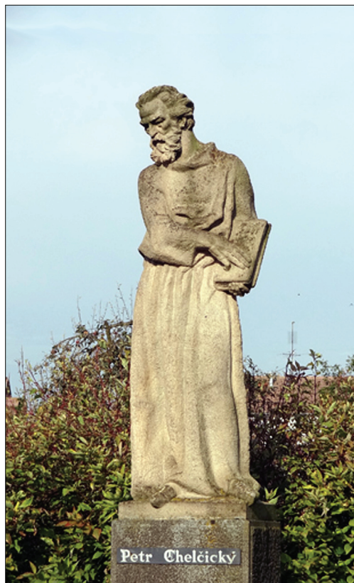
Современный памятник Петру Хельчицкому в Хельчицах.

Группа «братьев» формировалась вокруг Петра Хельчицкого. В сборнике своих проповедей, в качестве наставника, а не полемиста, Хельчицкий объяснял им, как христиане должны жить. Он ожидал, чтобы они оставались отдельно от мира, чтобы они отказались от всех видов насилия, чтобы их собрания остались простыми, чтобы они жили трезво и смиренно и трудились добросовестно. «Бра-