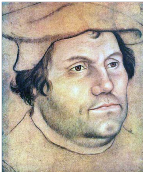
Портрет Мартина Лютера (Лукас Кранах. рисунок, ок. 1532).

и таинственности и есть вера, и, входя в эту атмосферу, нужно отказаться от разума и верить «святым» историям, и в этом выражается почтение Богу? Может быть, я неправильно верую? Их вот — целая улица, а я один? А мне так не хотелось отличаться от других, а быть как все. Но моя вера, и атмосфера семьи, в которой я рос, уже сформировали внутри некий стержень, который заставлял меня быть самим собою.