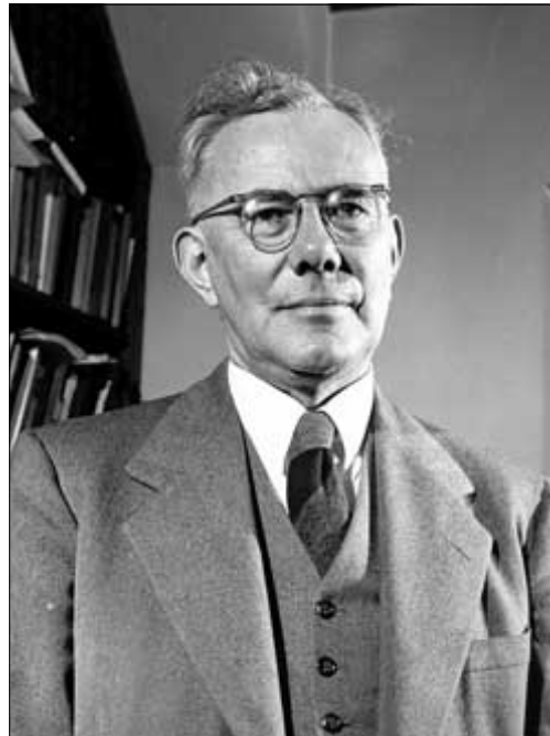
Пауль Тиллих (1886–1965)

В первом томе «Систематического богословия» Тиллих предложил «метод корреляции» между «философскими вопросами» и «богословскими ответами». [7] Тиллих считал, что философское описание человеческой ситуации, предложенное философией экзистенциализма создает «вопрос», который должен сформулировать