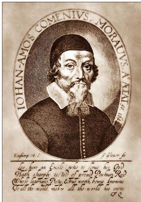
Johan-amos Comenivus, Morauius a Atat, 1642.

Следует отметить большой вклад Коменского как убежденного миротворца. Миротворчество Яна Коменского было настолько последовательным и серьезным, что ему доверяли даже враги, которых у великого чешского педагога просто не было. Ярчайшим примером такого доверия его убеждениям является предложение о сотрудничестве такого яркого представителя католицизма во Франции, как кардинал Ришелье. Этот факт является весьма поразительным на фоне общих католических преследований всех протестантов, из которого Ришелье сделал исключение лишь лидеру чешских братьев. Это значит, что если бы все протестанты стали чешскими братьями, все религиозные войны в Европе бы прекратились. Кстати, хотя Коменский отказал Ришелье, но довольно плодотворно поработал в лютеранской Швеции. А лютеране, как известно, весьма подозрительно относились к чешским братьям, считая их еретиками. И снова-таки он разработал учебную программу для Шведской академии и двадцать восемь лет прожил в польском городе, входившем тогда в шведское государство. И все же, иезуиты позаимствовали некото-