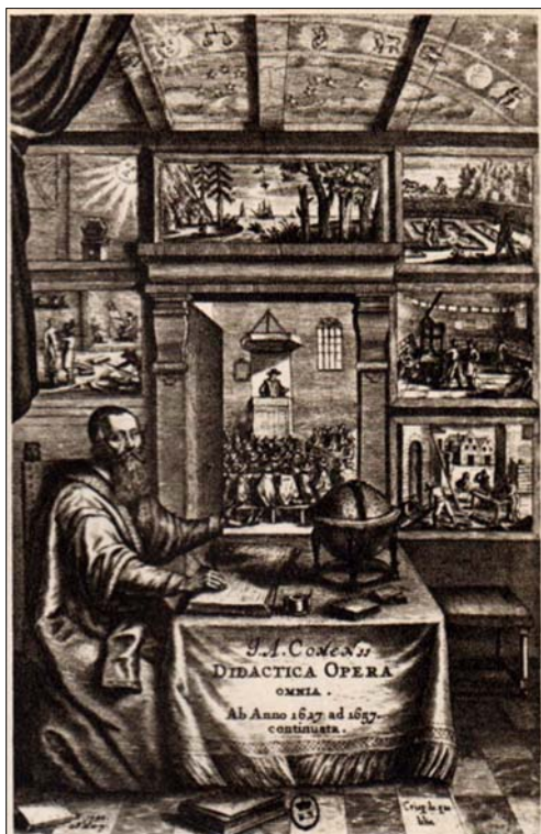
Didactica Opera. Ab Anno 1627 ad 1657 continuata.

◆ Самым великим достижением великого чешского педагога и мыслителя было обращение лицом к человеческой природе, что сделало его выдающимся представителем христианского гуманизма. Ян Коменский не унаследовал от своей эпохи отрицательное отношение к человеческой природе. Если католики боролись с плотскими страстями, а кальвинисты