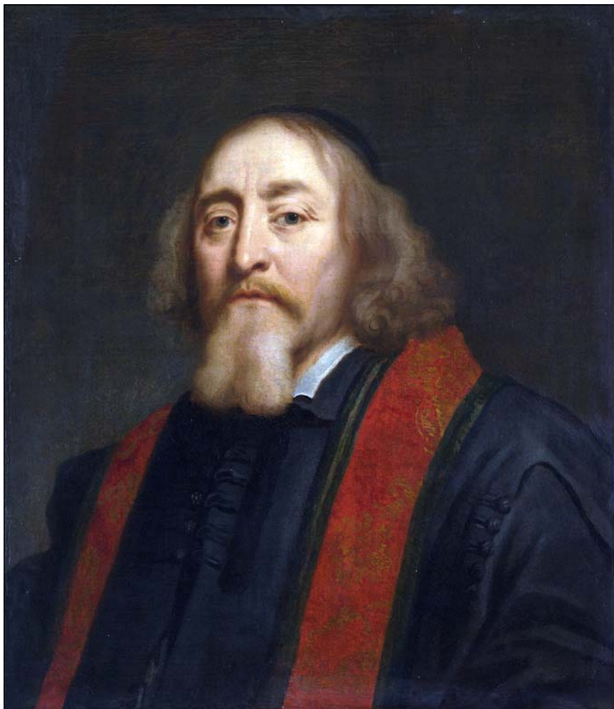
Портрет Яна Амоса Коменского (1592–1670). Художник Юрген Овенс (1623–1678), голландский живописец-портретист, ученик Рембрандта. Портрет был написан примерно в 1658–1660 гг. по заказу городского совета Амстердама. Хранится в Rijksmuseum в Амстердаме, сейчас передан во временное пользование Музею Коменского в Наардене.

исключительно ради спасения душ не только молодого поколения всех последующих времен и народов, но, по большому счету, и самих взрослых. Главный тезис своей педагогики Коменский изложил в «Пампедии» следующим образом: «Людей надо научить так любить земную жизнь,