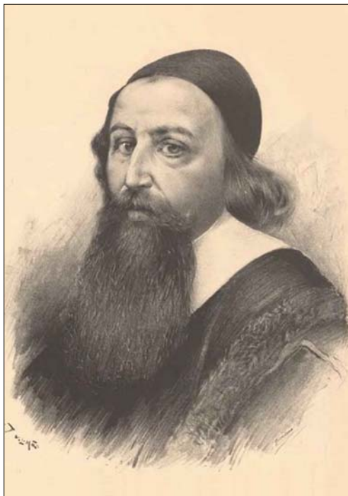
Ян Амос Коменский (1592–1670).

В 1667 году Коменский публикует работу «Ангел мира», в которой призывает человечество к решению спорных вопросов международной политики на основе доброй воли. Последним сочинением Коменского стало «Продолжение братского завещания» — это автобиография великого христианина, гуманиста, мыслителя, педагога. Скончался Ян Амос Коменский 15 ноября 1670 года и был похоронен в Наардене, вблизи Амстердама.