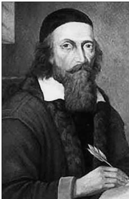
Ян Амос Коменский (1592–1670).

4. «Сеть веры» (1440-1443) – наиболее крупное произведение Хельчицкого. Автор убеждён, что истинная христианская вера представляет собой спасающий от грехов невод, который пытается разрушить Папа Римский и его кардиналы.