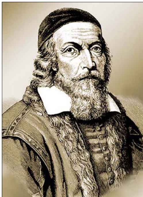
Ян Амос Коменский (1592–1670).

Таким образом, светское образование и духовное воспитание, которые Коменский никогда не противопоставлял друг другу, стали возможны, по его мнению, поскольку человек может изменяться, в том числе и к лучшему. Коменский первым повернул образование его дней в русло общенародного, массового, демократического, т.е. не делающего различия между человеческими сословиями. Великий чешский педагог был уверен в том, что, если каждый человек может возрастать духовно, повышая свой уровень всестороннего образования, включая и религиозное, он сможет решить большинство своих жизненных проблем.