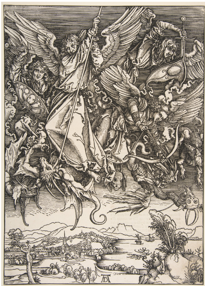
Битва архангела Михаила с драконом. Апокалипсис (Альбрехт Дюрер, 1498 г.)

Существует превратное мнение, будто зло — это некий вирус, которым чистый может заразиться от грешника. Может быть, эта метафора и верна в некотором смысле в определенных условиях, но, рассуждая о природе зла и о его истоках, богословы придерживаются несколько иной точки зрения. Зло не является субстанцией или сущностью, существующей самой в себе. Августин пишет, что зло — «не субстанция: это извращенная воля, от