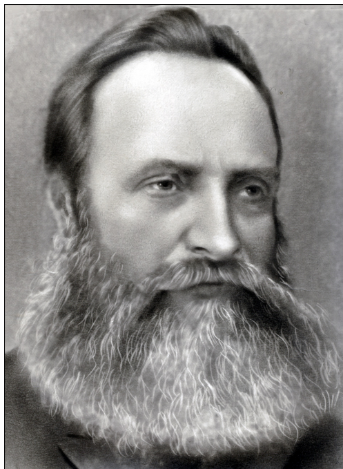
Мартин Карлович Кальвейт (1833–1918)

внутренней борьбы и тщательного изучения Слова Божия сложились у него самого: Встретились братья по вере. Немедленно же Воронин пожелал креститься, и 20 августа 1867 года ночью М. К Кальвейт крестил его в реке Куре в гор. Тифлисе».