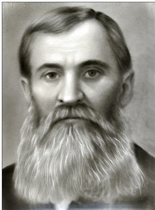
Яков Делякович Деляков (1829 – 1898)

Северовых и Танасовых. прим. Валькевича ), от которых я услышал о необходимости Св. Кр. Водой. О чем я стал серьёзно думать и у меня явилась духовная потребность искать истины Спасения, затем я познакомился с Мосьвилом (очевидно Мельвилом) и Деляковичем в 64 и 65 годах, от которых я подобно Аполос от Акила и Прискилы точнее узнал путь Господен. Тогда вполне во мне созрело ясно познания истины во Христе, и осталось мое желание исполнить безотлагательно Св. Крещения при первом случае. 1867 г. в августе 20-го дня пришел ко мне Я. Деляков объявил мне, что есть в Тифл. верующие немцы и он говорил с ним обо мне и обещал меня привести к ним, которых я никогда не видел и не знал их и он присовокупил, что они настоящие христиане и вот случай теперь можно принять крещение, я решился пойти с ним и мы 20 августа 1867 года по-