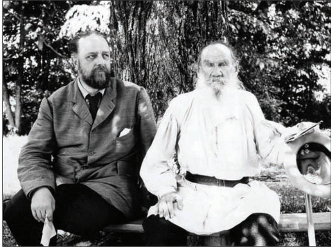
Лев Николаевич Толстой и Владимир Григорьевич Чертков.

кажется, что она относится ко мне враждебно. Если можете, напишите мне про это. От меня же передайте ей мою любовь. Потому что я не могу не любить вашу мать. И мне бы больно было знать, что я ей неприятен» [45] .