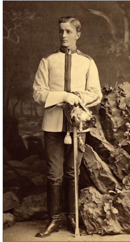
Владимир Григорьевич Чертков

буду тебе сочувствовать и просить Бога, чтобы Он всегда поддерживал тебя в исполнении каждого долга и чтобы Он не допускал, чтобы даже я могла смущать или колебать тебя, когда Его воля высказана. Спокойной ночи, мальчик мой» [40] .