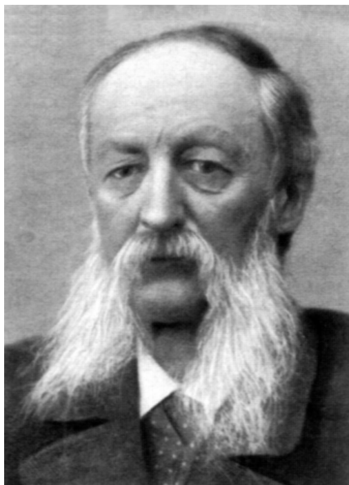
Василий Александрович Пашков (1831 – 1902)