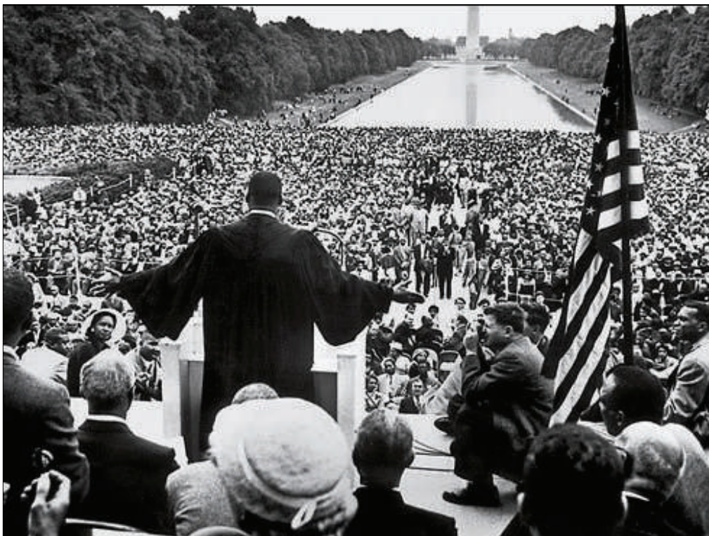
Доктор Мартин Лютер Кинг выступает перед участниками Марша за гражданские права, собравшимися на площади перед Мемориалом Линкольна, Вашингтон, 28 августа 1963.

Азии, которые они не смогли найти в юго-западной Джорджии и в восточном Харлеме» [49] . Из-за такой позиции очень многие критиковали Кинга и даже обвиняли в том, что он — враг Америки. В одной из своих проповедей он дает ответ своим друзьям из Южной Христианской Конференции Лидеров, которые советовали ему молчать о войне во Вьетнаме, чтобы не враждовать с президентом Джонсоном и теми, кто финансово поддерживал эту организацию: