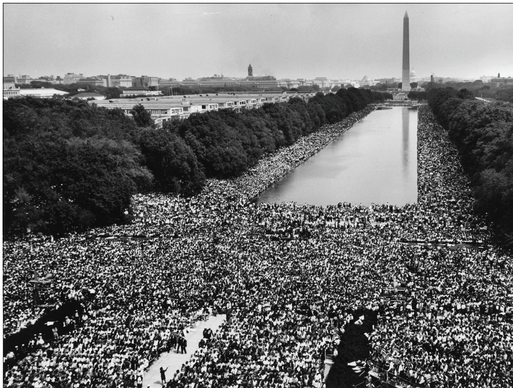
Участники Марша за гражданские права, собравшиеся на площади и аллеях вокруг бассейна перед монументом Вашингтона, Вашингтон, округ Колумбия, 28 августа 1963.

«Никто не может правильно понимать убеждения Мартина Кинга относительно Вьетнама, власти черных, расизма и бедности без стремления узнать роль «проповедника как пророка» в черной общине. Когда черный проповедник верен своему призванию, он должен говорить Божью истину, независимо от тех, на кого влияет его суждение» [47] .