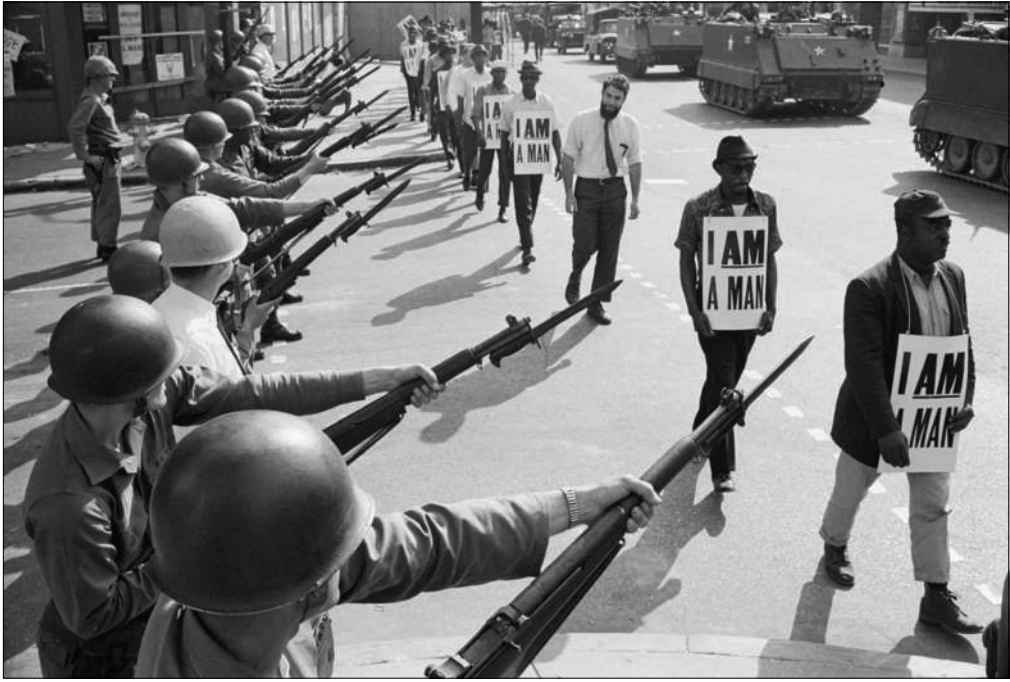
Войска Национальной гвардии США блокируют Бил-стрит, по которой проходит колонна чернокожих демонстрантов за гражданские права, несущих плакаты с надписью: Я – ЧЕЛОВЕК, 29 марта 1968 года.

ственности администрация президента Кеннеди наконец-то была вынуждена вмешаться в события в Бирмингеме. 20 мая 1963 года Верховный суд США признал сегрегацию в Бирмингеме незаконной. 23 мая Верховный суд Алабамы отправил в отставку Юджина Коннора.