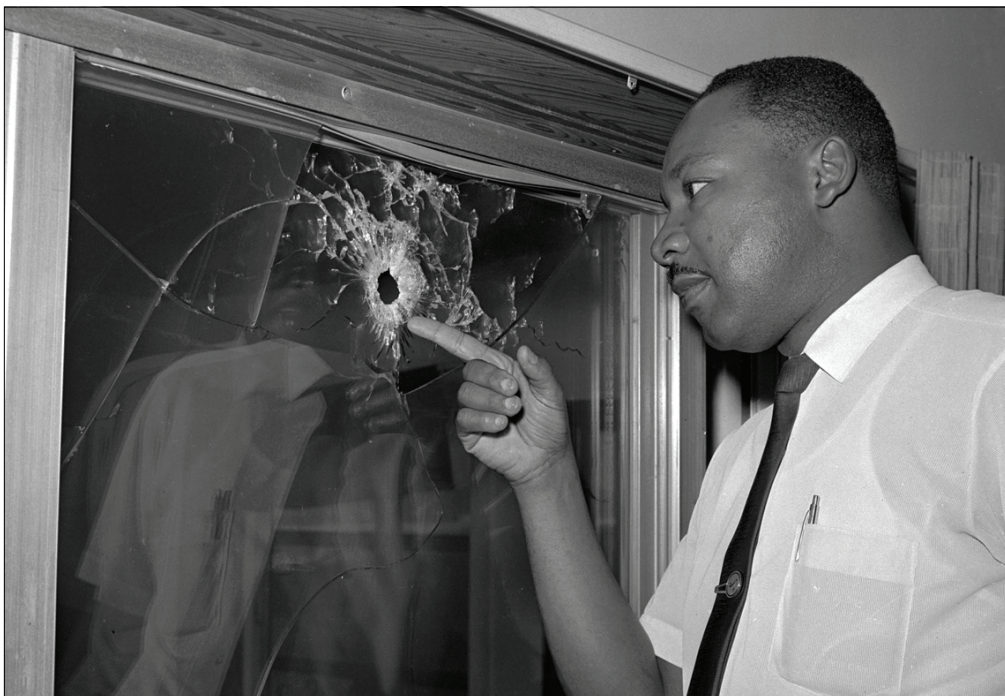
Мартин Лютер Кинг указывает на пробитую пулей стеклянную дверь своего съемного дома на побережье, который был обстрелян неизвестным, Санкт-Августин, штат Флорида, 5 июня 1964 год.

тивлению США избежали полномасштабной гражданской войны на Юге.