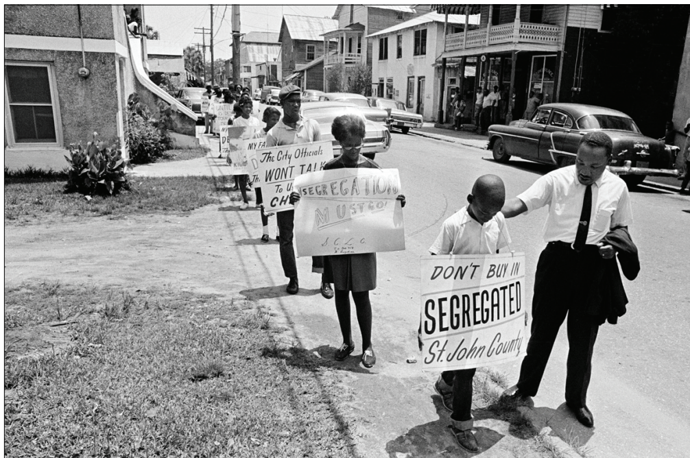
Доктор Мартин Лютер Кинг ободряет одного из юных участников акции пикетирования против сегрегации, Санкт-Августин, штат Флорида, 10 июня 1964 год.

противника, но пытаются завоевать его дружбу и понимание, пробудить моральный стыд у противника. Целью является освобождение и примирение.