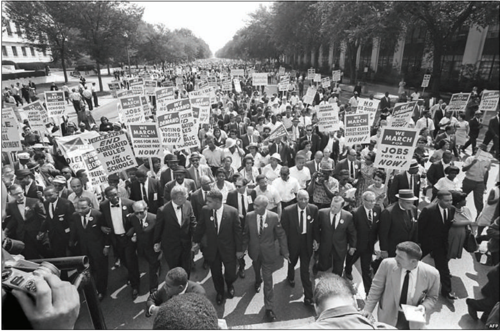
Лидер Движения за гражданские права и проповедник Мартин Лютер Кинг (3-й слева) во главе Марша на Вашингтон, 28 августа 1963 г. Марш проводился за рабочие места и свободу.

Мы видим, что эти обязательства проникнуты духом учения Христа, и это является хорошим примером того, что христиане могут инициировать акции протеста, в которых будет преобладать не жажда мести, а дух любви.