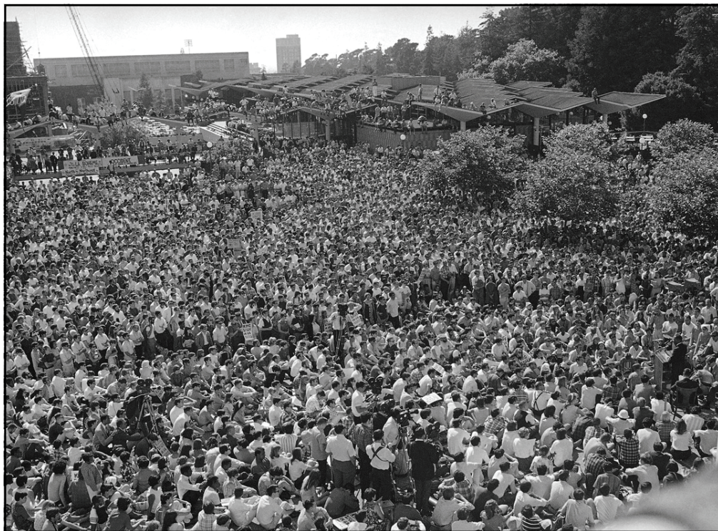
Предположительно, более 5000 участников внимательно слушали речь доктора Мартина Лютера Кинга (справа) в Sproul Hall, Калифорнийского университета Беркли, штат Калифорния, 17 мая 1967 года.

когда этот указ используется для того, чтобы сохранить сегрегацию и лишить граждан предусмотренного в первой поправке к конституции права на мирные собрания и мирный протест, тогда этот указ становится несправедливым.