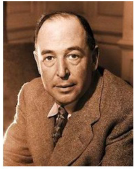
Клайв Стейплз Льюис (1898–1963)

анской вере (с. 255). Во времена Второй мировой войны Льюис ведет радиопередачи на общенациональном радио. Будучи мирянином и находясь вне структур церковной власти, он имел возможность объяснять, что такое христианская вера более чем миллионной аудитории слушателей. Льюис не излагал Евангелие, а приготавливал встречу слушателей с Евангелием. Это было preparation evangelica , а не evangelium . Благодаря радио, Льюис стал таким себе «голосом веры» для английского народа. Из передач родилось то, что в дальнейшем стало «просто христианством» — единым, неκληрикальным выходящим за пределы деноминаций пониманием христианской веры. Эти радиобеседы сделали Льюиса знаменитостью общенационального масштаба. Одни им восторгались, другие критиковали.