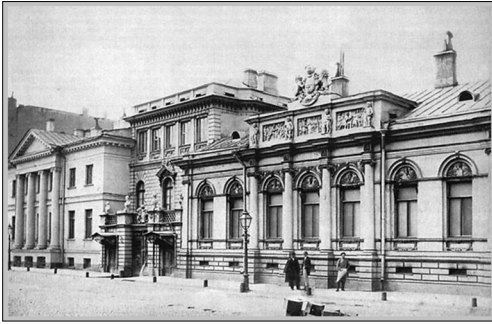
Дом Гагариных в Санкт-Петербурге.

никли ей в сердце и не давали ей покоя. Она спросила себя, если бы Господь задал ей сегодня такой же вопрос, она бы не знала, что ответить, не знала, где находится её душа: среди спасённых или погибших. А когда в конце собрания прозвучали давно знакомые ей последние слова Христа на кресте: