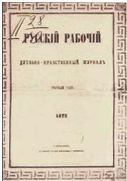
Обложка журнала «Русский рабочий»