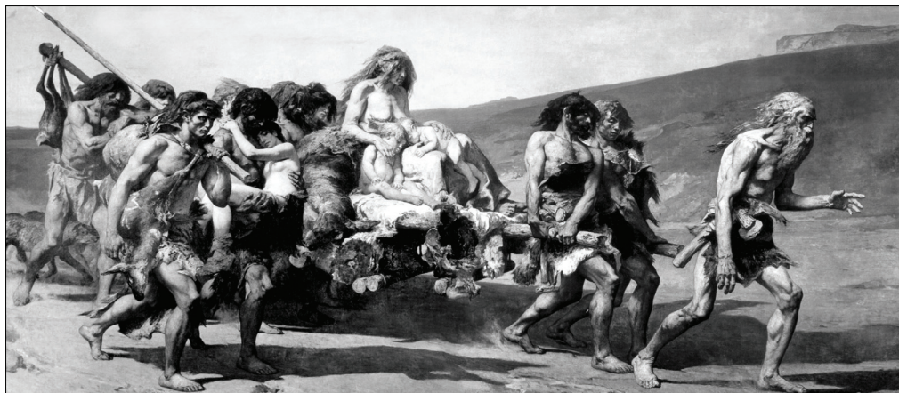
Бегство Каина (фрагмент). Кормон, Фернанд. Музей d'Orsay, Париж

Каин изображен изможденным стариком, вечно убегающим по пыльной сухой долине, ведущим за собой свою измученную семью в никуда. Его мускулы напряжены, его горящий взор устремлен вдаль. Как будто бы беглецы вот-вот достигнут заветного оазиса, где их многострадальный бег окончится! Но впереди, там, куда они так стремятся, лишь та же самая красная пыль, которая взмывается вверх, поднятая движением их ног!