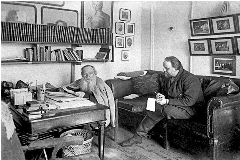
Лев Толстой и Владимир Чертков в Ясной Поляне.

вполне понимает, что я должен жить по-своему, и что это ничему не помешает». [14]