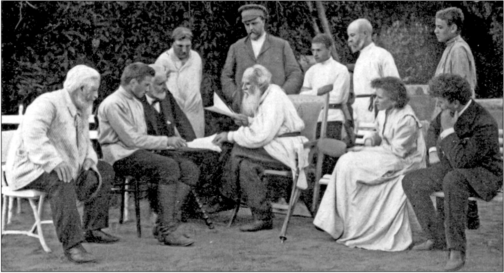
Лев Николаевич читает свое новое произведение в кругу друзей у В.Г. Черткова (Мещерское, июнь, 1910 г.)

беспредельной любви своей Христос Спаситель Ваш не захочет Вас допустить». [20]