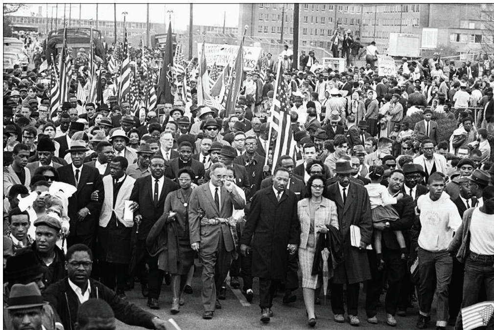
Доктор Мартин Лютер Кинг вместе с женой, Кореттой Скотт Кинг, возглавляют Марш за гражданские права, проходя по улицам г. Монтгомери, штат Алабама, 25 марта 1965 г.

людской призыв стать их представителем. Мартин Кинг вспоминал Нагорную проповедь с её учением о любви. Он искал метод борьбы, который соответствовал его вере в Христа и был приемлем для его сердца. [22] Со временем к нему приходило более глубокое понимание силы ненасилия. Ненасилие стало обязательством жить определённым образом.