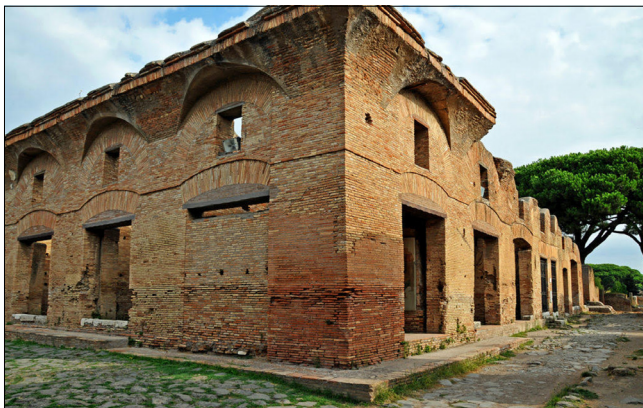
Будівля інсули в Остії.

них будівель до отримання легального статусу в Римській імперії за часів Костянтина, [28] а до того часу використовували для зібрань приватні будинки. [29]