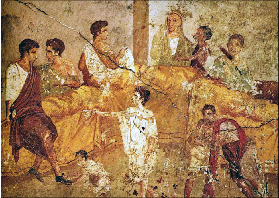
Сімейний пір. Фреска із тріклініума в Помпеях.

помісної церкви, місцем зборів для поклоніння, готелем для місіонерів і посланців і, в той же самий час головним і вирішальним місцем християнського життя і формування”. [65] На думку Роджера Герінга “принаймні в перші роки трикліній (іноді разом із зовнішнім двором ... або атриумом) становив більш-менш ідеальне місце для навчання і проповіді, катехізичних хрещальних настанов і іншої місіонерської діяльності церкви”. [66]