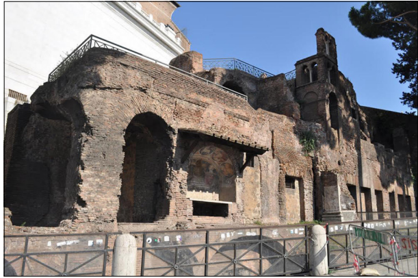
Будівля інсули Аракоелі в Римі.

новок, що група Асинкріта і ін. (Рим. 16:14) і група “святих” (Рим. 16:15) належать до церков, які збиралися в інсулах. [44] Ці ж висновки він поширює на церкву, описану в посланнях до Солунян. У Діях Апостолів зустрічається опис ранньохристиянського зібрання у приміщенні на третьому поверсі інсули. Це зустріч Павла з християнами в Троаді (Дії 20:5-12). Також християни могли збиратися в майстернях на перших поверхах інсул (пор. Дії 18:2-3), де знаходилися майстерні або інші великі приміщення. Фізичні умови життя і діяльності ранніх домашніх церков відсилають нас до соціально-економічних реалій першого століття.