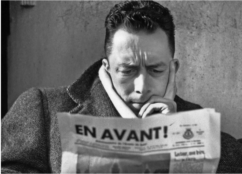
Альбер Камю — французский прозаик, философ и эссеист. Лауреат Нобелевской премии по литературе 1957 года.

в своем роде» (Лк. 16:8). Некоторым сынам века сего приходят идеи, которые отражают принципы, очень полезные для жизни общества, особенно при наступлении критических ситуаций, таких как пандемия коронавируса. Одним из таких сынов, по-моему, был Альбер Камю. Мне хотелось бы порассуждать об идеях, которые были изложены этим писателем в его книге «Чума», а также о том, как эти идеи могут быть полезны сегодня в нашей непростой ситуации, по крайней мере, христианам.