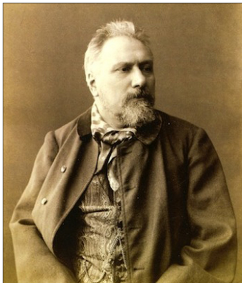
Писатель Николай Семёнович Лесков (1831–1895).