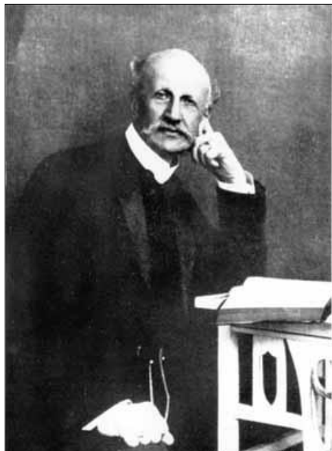
Граф Модест Модестович Корф (1843–1936).

Оправдывались слова 12-го стиха 1-ой главы Ев. Иоанна: «Тем, которые приняли Его, верующим во имя Его, дал власть быть чадами Божиими»... Было ясно, что для многих пришёл Божий час» [6] .