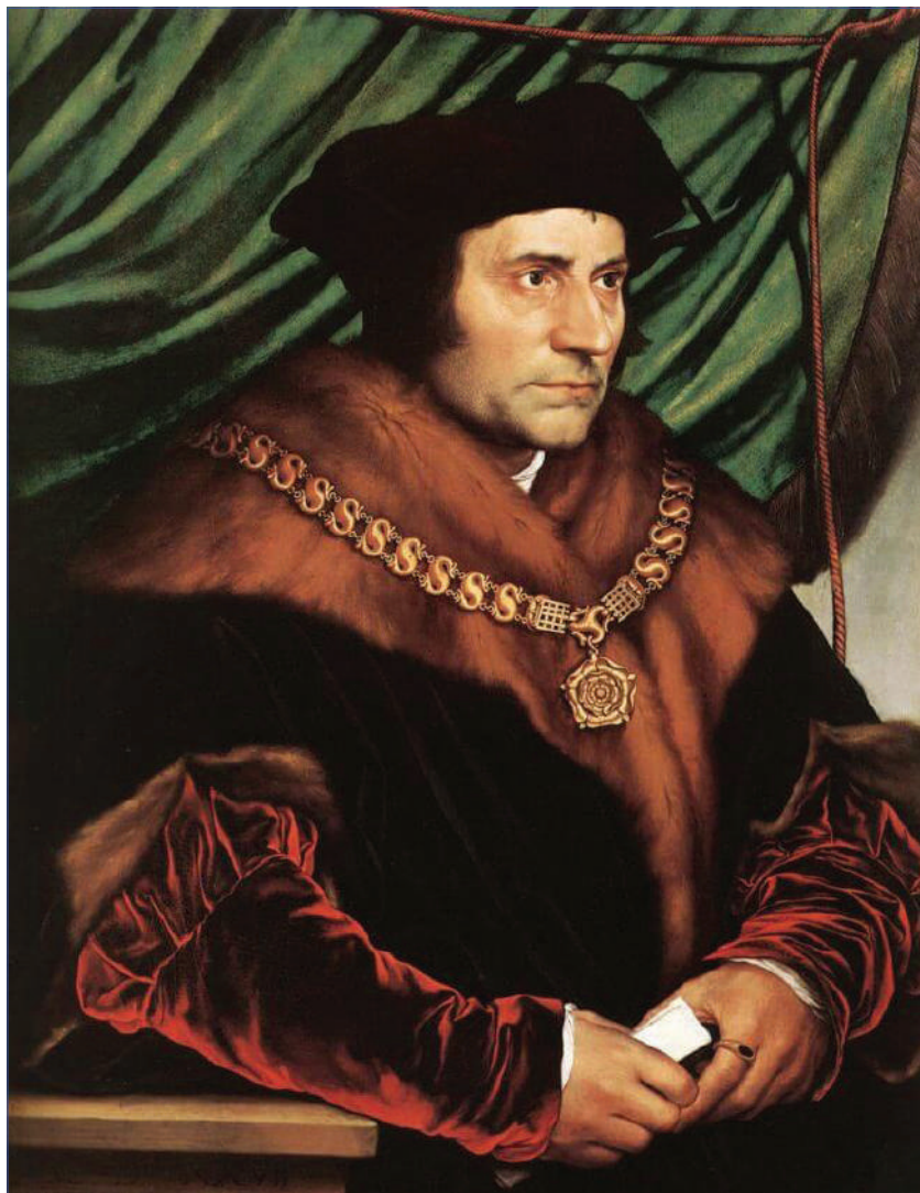
Портрет Томаса Мора. Автор Ганс Гольбейн Младший, Коллекция Фрика, Нью-Йорк, 1527 г.

письмо к Петру Эгидию. Книга практически сразу же стала бестселлером. Впрочем, более подробно мы поговорим о ней ниже.