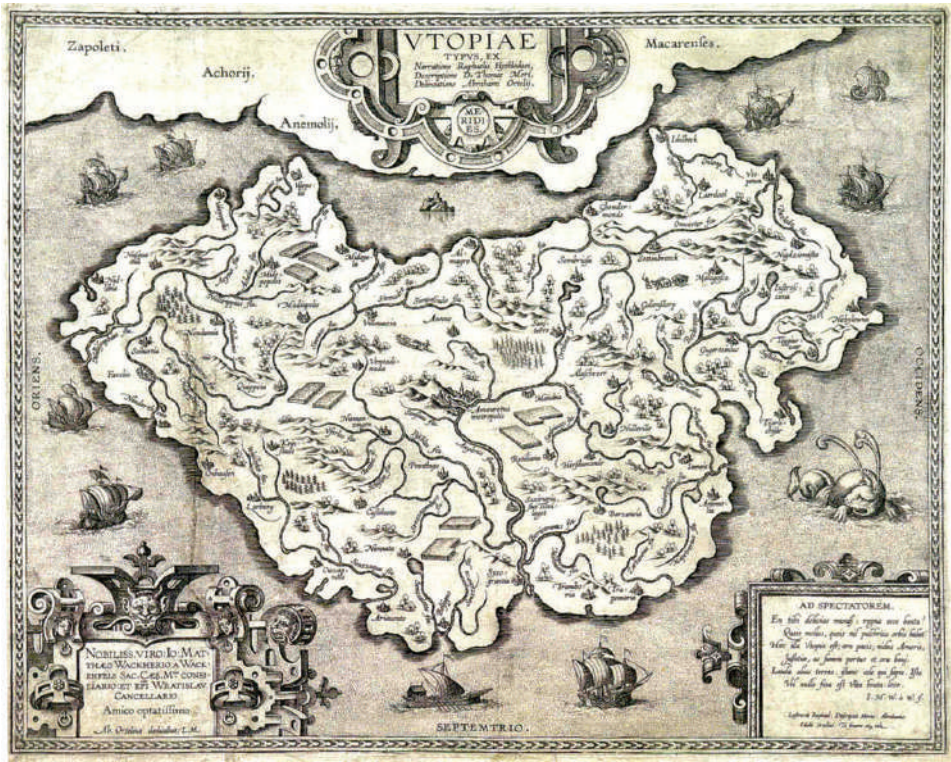
Карта «Утопии» в представлении Авраама Ортеля, 1584

даться постоянно, как должен выглядеть его дом и какого покроя должна быть его одежда... Утопиец не может даже покинуть свой город без разрешения властей. Да в этом и нет большой необходимости, поскольку все города одинаковы. Каждый человек занимается сельским хозяйством, вне зависимости от тяги к этому труду.