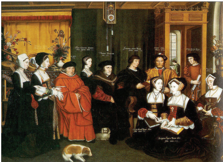
Семейный портрет сэра Томаса Мора. Автор Ганс Гольбейн Младший, 1527 г.

рабочих и их содержание стали очень дешевыми. За невинным названием экономической политики скрывался ужас, с которым не всякий целенаправленный геноцид может сравниться.