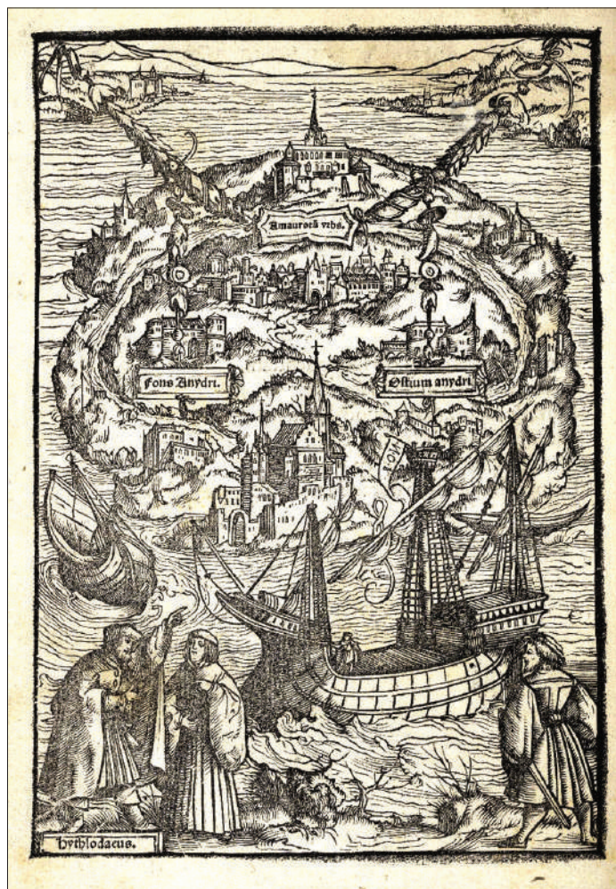
Общий вид острова «Утопия» из базельского издания, 1518 г. Гравюра Ганса Гольбейна Младшего.

У утопийцев практически нет частной собственности. Получая необходимый запас продуктов и вещей, они не делают запасов из денег или золота. Деньги и золото есть лишь в государственной казне, преимущественно для торговли с другими странами. Все это делает Мора родственным социалистам с их идеями о всеобщем равенстве и их противостоянию частному капиталу. В социалистической историографии он даже называется провозвестником социалистического учения [21] .