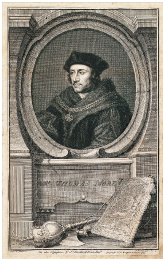
Сэр Томас Мор (1478 – 1535)

Увещание и внушение лежат на обязанности священников, а исправление и наказание преступных принадлежат князю и другим чиновникам. Но священники отлучают от участия в богослужении тех, кого они признают безнадежно испорченными. Ни одного наказания утопийцы не страшатся больше этого. Именно, подвергшиеся ему лица испытывают величайший позор, терзаются тайным религиозным страхом, и даже личность их не остается долго в безопасности. Если они не поспешат доказать священникам свое раскаяние, то подвергаются аресту и несут от сената кару за свое нечестие. Священники занимаются образованием мальчиков и юношей. Но они столько же заботятся об учении, как и о развитии нравственности и добродетели. Именно, они прилагают огромное усердие к тому, чтобы в еще нежные и гибкие умы мальчиков впитать мысли, добрые и полезные для сохранения государства. Запав в голову мальчиков, эти мысли сопро-