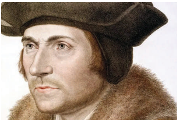
Портрет Томаса Мора (фрагмент). Автор Ганс Гольбейн Младший

Мор женился повторно на вдове Алисе Миддлтон. По выражению Эразма она была немолода и непривлекательна, но Мор вел себя с ней так, как будто она была красавицей. Несмотря на свою загруженность, Мор всегда находил время для общения, с женой, с детьми, даже с прислугой. Всем своим детям Мор дал хорошее образование. Особенно здесь отличилась Маргарита, она переводила древние книги с греческого на латынь и даже давала толкования. Сохранилось высказывание самого Мора, показывающее, каким он был семьянином: