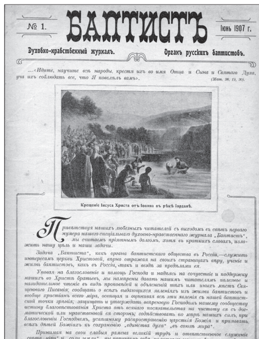
Журнал «БАПТИСТЪ», №1, июнь 1907 г.