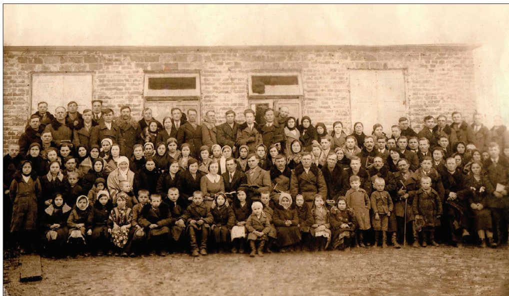
Громада вільних євангельських християн у Башарівці, кінець 1930-х років.