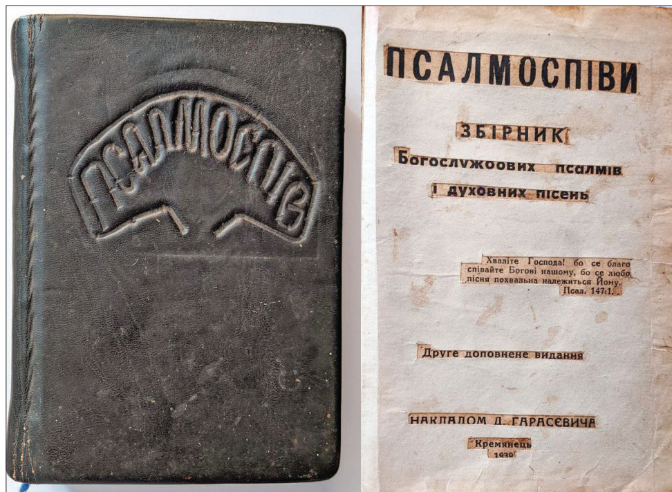
Співник Євгенії Корнійчук. Псалмоспів. Збірник Богослужбових псалмів і духовних пісень. Друге доповнене видання. Накладом Л Гарасевича. Крем'янець, 1939 р.

сім'ї виходять далеко за межі особистого простору, окремих родин, вони стосуються наступних поколінь, а відтак – усієї нації.