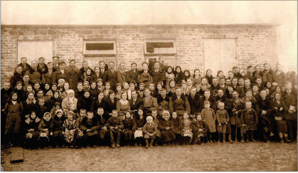
Громада вільних євангельських християн у Башарівці, кінець 1930-х років.