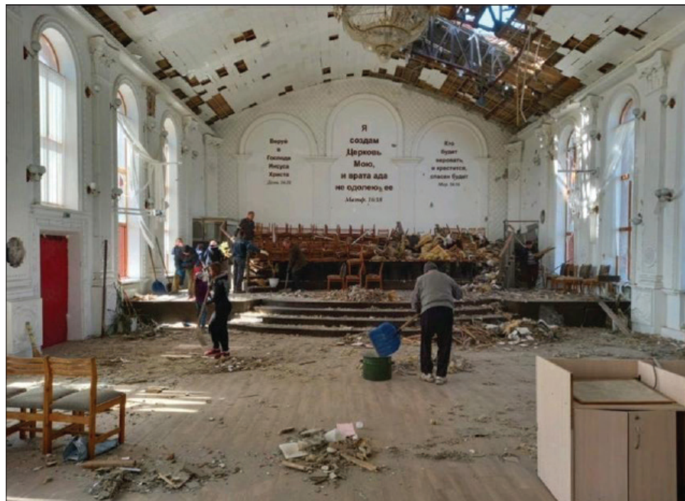
Пошкоджений внаслідок обстрілів молитовний будинок Центральної церкви ЄХБ г. Маріуполь.