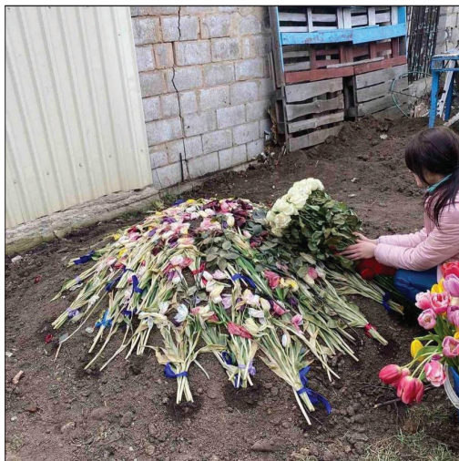
Місце поховання загиблих братів дияконів у дворі молитовного будинку Центральної церкви ЄХБ г. Маріуполь.