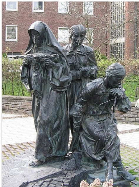
Пам'ятник Едіт Штайн у Кельні.

Саме в цей час в Ехті вона завершила свою останню велику наукову роботу «Наука Хреста». Керівництво попросило її написати працю на благо своїх побратимів-кармелітів на честь чотирьохсотліття від дня народження святого Іоанна від Хреста. Її метою було написати дослідження про великого містика «...в єдності його істоти, як вона виражається в його житті і в його творах...» [29] . Робота була завершена за лічені місяці, але «... [вона] насправді роздумувала над нею роками... Тому ця книга пропонує не тільки сучасний виклад св. Іоанна Хреста, а й особисте свідчення сестри Бенедикти» [30] .