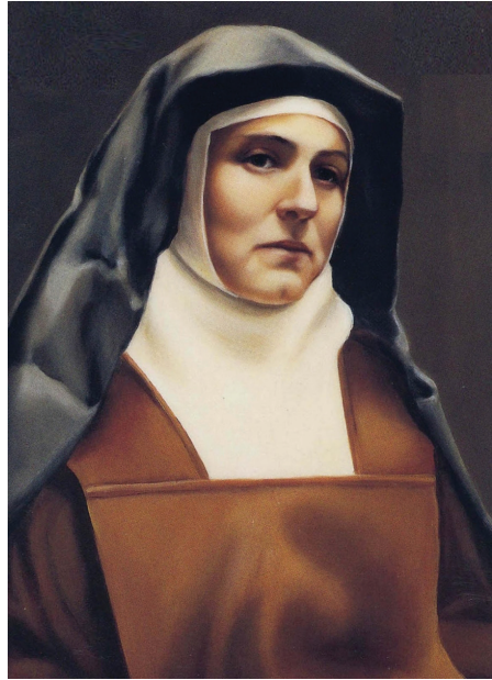
Тереза Бенедикта від Хреста (1891 – 1942)

Мері Рейбер. ХРЕСТ СЕСТРИ ТЕРЕЗИ БЕНЕДИКТИ ВІД ХРЕСТА