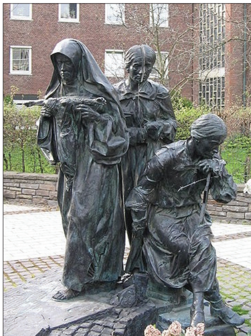
Памятник Эдит Штайн в Кёльне.

Предполагается, что она была отравлена газом в Аушвиц-Биркенау сразу после прибытия 9 августа 1942 года.