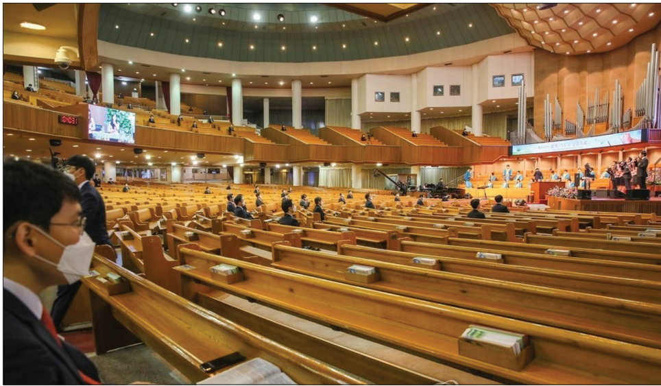
Недільне служіння в церкві Повного Євангелія Йойдо, Сеул, 15.03.2020 р.

У цей час уперше за 236 років існування церкви у Південній Кореї було закрито понад 1700 церковних споруд [18] .