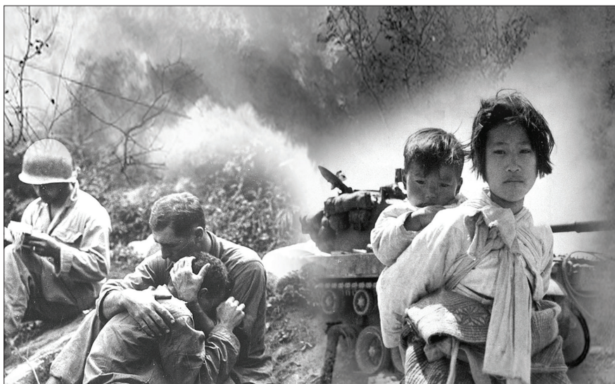
Війна у Кореї 1950 - 1953 рр.

Війна на Корейському півострові, що почалася 26 червня 1950 р., закінчилася в 1953 р., залишивши після себе безліч жакливих наслідків, зокрема зруйновані будівлі церков і безліч загиблих [21] , принісши невимовні лиха. Це була найбільш кровопролитна і руйнівна війна з часів Другої світової війни. Ця війна принесла корейському народу величезні лиха і страждання, яких він ніколи раніше не відчував. Було втрачено життя і майно сотень тисяч людей, з'явилася незліченна кількість сиріт, вдів, біженців і людей, що живуть у злиднях, багато хто був змушений жити в неймовірних стражданнях.