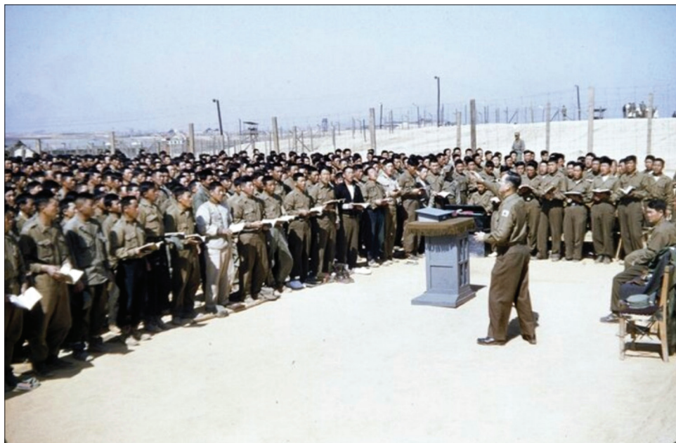
Богослужіння корейських християн у трудовому таборі для ув'язнених.

звело до того, що невелика кількість вірян, які проживали в країні, стали розсіюватися і ховатися.